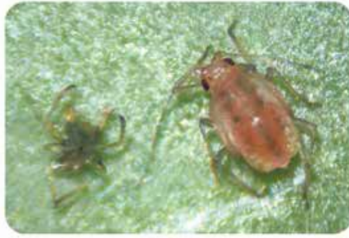
12h tras la aplicación