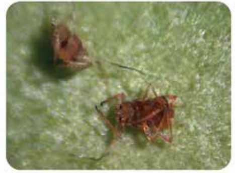
24h tras la aplicación